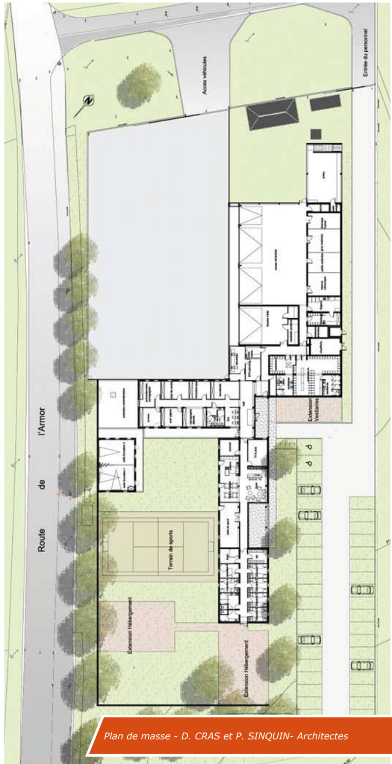
Plan de masse - D. CRAS et P. SINQUIN- Architectes